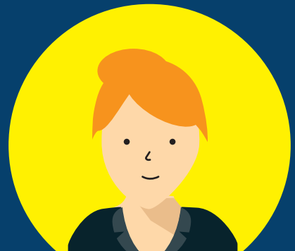
電気・電子情報関連産業