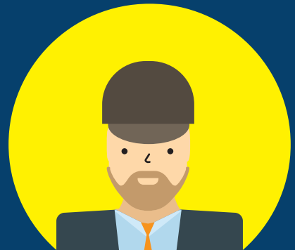
造船船用工業・自動車整備