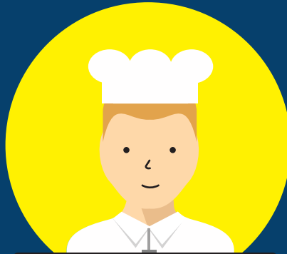
飲食料品製造・外食業