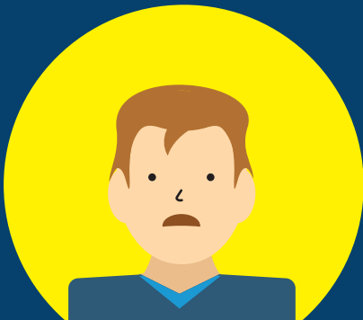
ビルクリーニング・素材材産業